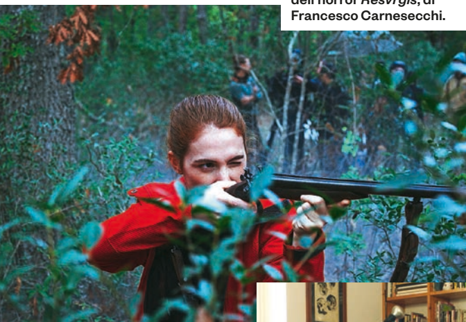
Durante una scena dell'horror Resvrgis , di Francesco Carnesecchi.