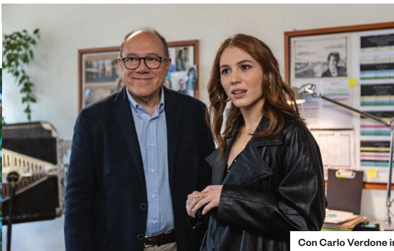
Con Carlo Verdone in Vita da Carlo 2 , in onda su Paramount+.